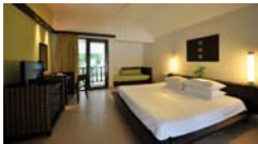
ซูพีเรีย