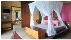
ลาจูน ลูท