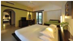
ซูพีเรียแบบห้องคู่