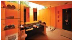
บิซ วิลล่า