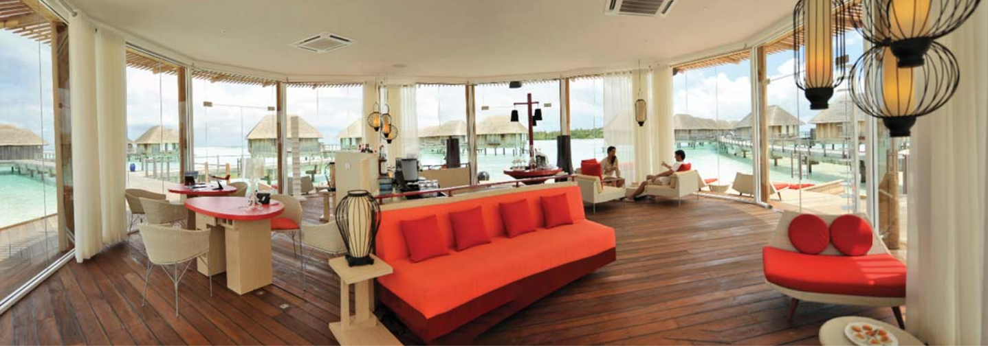
แมนต้า เล้าจ์